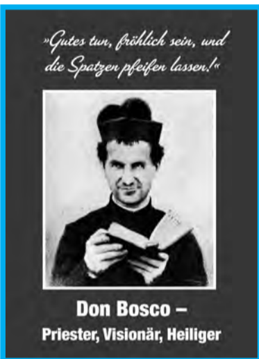
Don Bosco – Priester, Visionär, Heiliger

Anzeige erstattete eine Tirolerin, weil deutsches Unterrichtsmaterial (z.B. „Können Kinder schwul sein?“) an 8jährige verteilt wurden. Präsidentin Beate Palfrader im Landesschulamt: „Zu ähnlichen Vorfällen darf es nie mehr kommen.“ CM-Buch: Genderwahn (5 €)