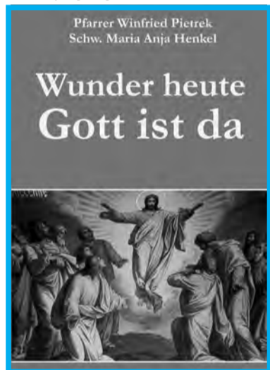
CM-Buch (5 €)

In Malaysia (13% Christen) nutzen diese das Wort Allah für GOTT, auch wenn beide einander stark unterscheiden. Das wurde den Christen verboten, bis der Oberste Gerichtshof jüngst anders entschied. CM-Buch: Christenverfolgung (5 €)