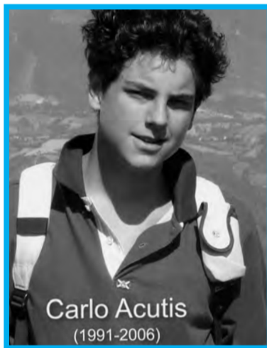
CM-Buch: Carlo Acutis, der neue Internet-Selige (10 €)

Helgolands 130 Katholiken leiten Urlaubspriester. Immer neu stoßen gesundheitssuchende Allergiker zur Gemeinde St. Michael. Hoffmann von Fallersleben dichtete 1841 auf Helgoland das Deutschland-Lied. Am 3.10. Dank-singen für deutsche Einheit in 250 Städten.