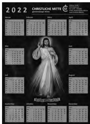
CM-Kalender 2022 (5 €, ab 10 je 2 €)

Bestellungen nur im CM-Büro und ab 50€ nur mit Vorkasse