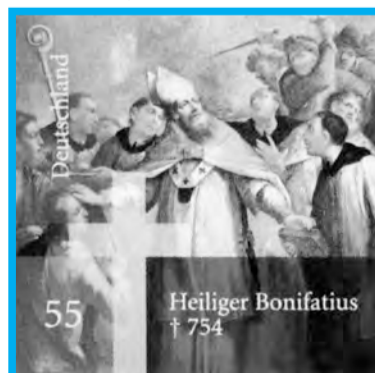
Die Briefmarke zeigt einen Gemäldeausschnitt von J.A. Herrlein: „Bonifatius vor seinem Martyrertod“.

Weit über die Hälfte aller Deutschen begrüßt den GOTTES-Bezug im Grundgesetz. Jeder Dritte wünscht einen verstärkten Einfluß der christlichen Grundhaltung in der Politik. Fast drei von vier Deutschen sind davon überzeugt, daß CDU/CSU christliche Wertvorstellungen nicht genügend umsetzen. Selbst 59% der Unions-Anhänger äußerten, daß ihre Parteien dem selbstgewählten Anspruch, christlich zu sein, nicht gerecht werden.