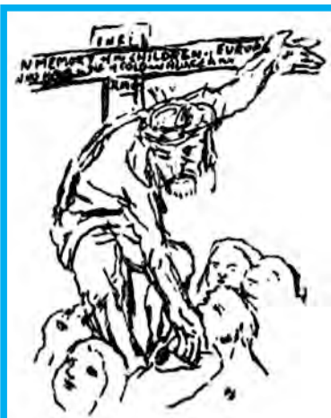
Christus hilft hungernden Kindern. Lithografie: Oskar Koschka, 1945, Steinzeichnung

Der Mitgliedsbeitrag beträgt 15 € zuzüglich 20 € für das verbindliche KURIER-Abonnement.